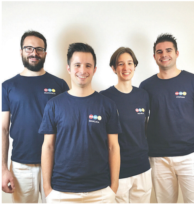
Il team dei fisioterapisti della Casa di Cura Bonvicini